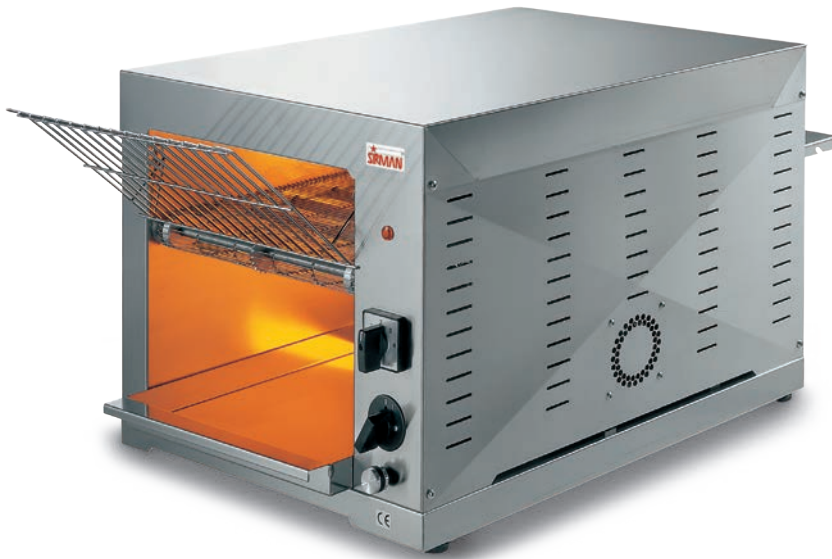
ROLLER LONG VV